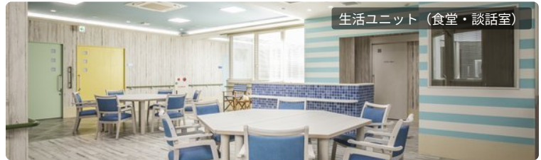
生活ユニット（食堂・談話室）